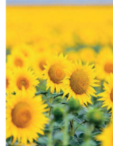
essential Roles of Leader ... RESULTS